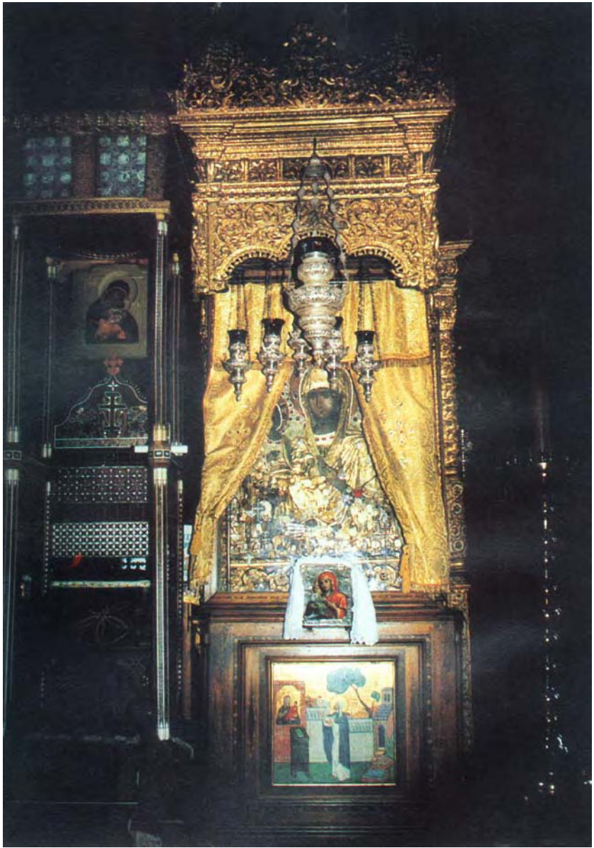
Чудотворна икона „Тројеручица” у игуманском трону у саборној цркви Манастира Хиландара