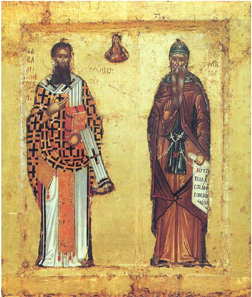
Свети Сава и преподобни Симеон Мироточиви, ктитори Манастира Хиландара