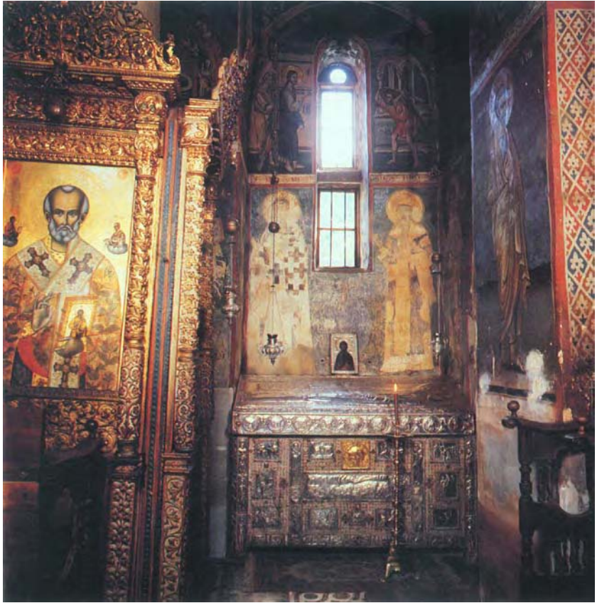
Кивот преподобног Симеона Мироточивог